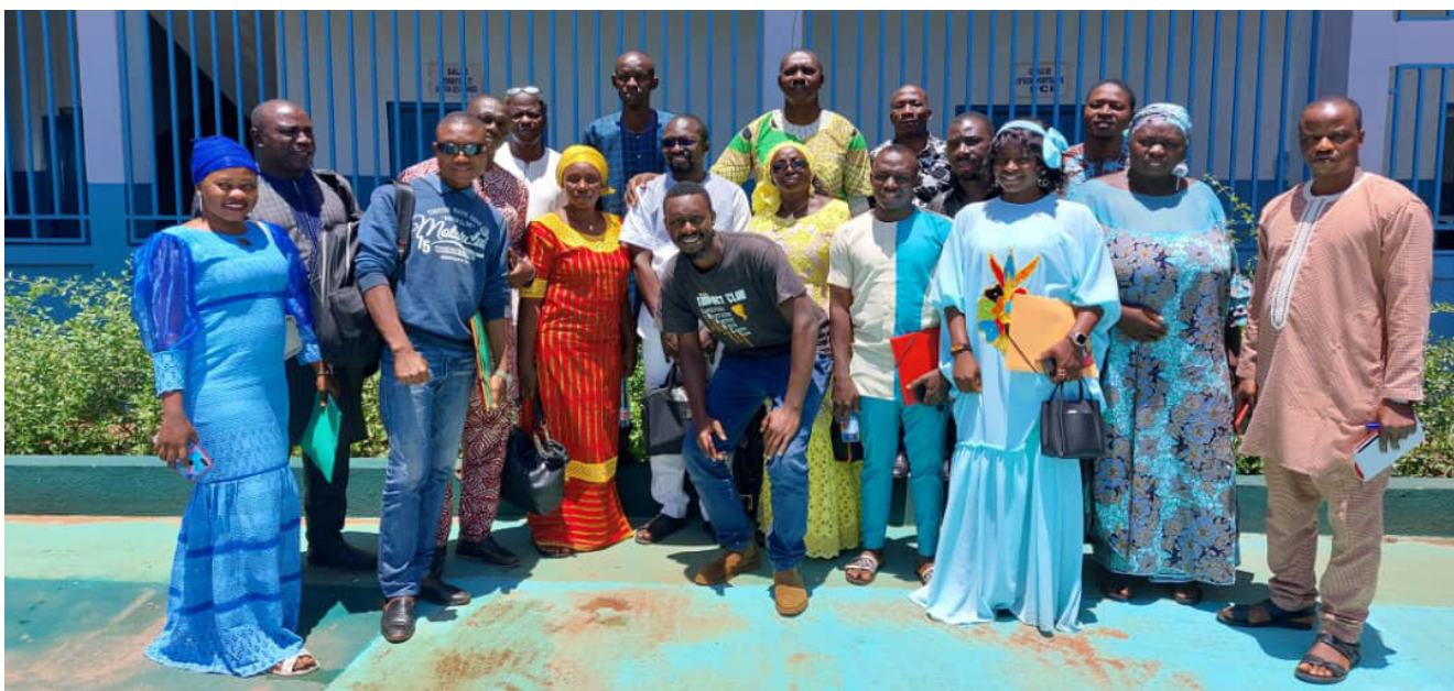
Les points focaux communication et promotion de la santé

du 14 au 19 septembre 2022 un atelier de formation sur la gestion des rumeurs sur la santé de la mère et de l'enfant à Kankan. L'objectif vise à renforcer les connaissances des acteurs impliqués dans la communica-