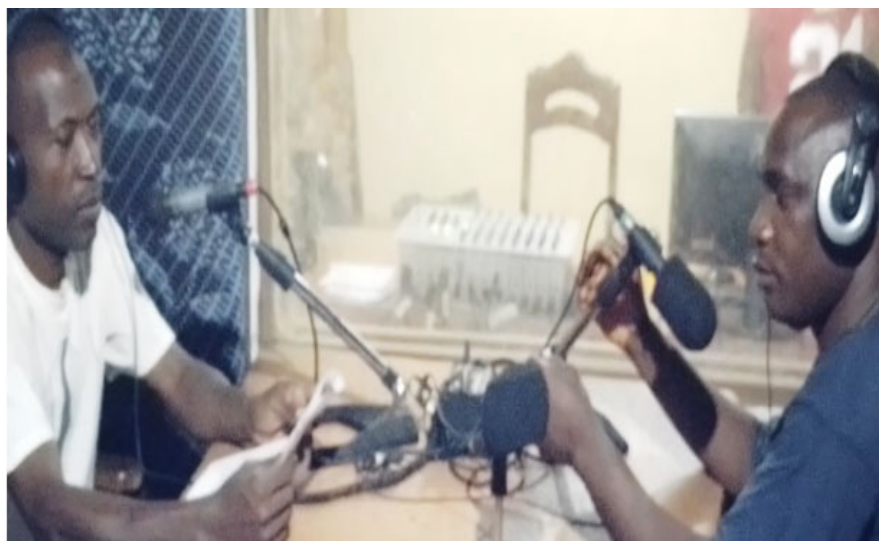
Point focal promotion de la santé animant une émission de table ronde à la radion rurale de Beyla.

caractérisé(é) par la perte de confiance entre prestataires et les communautés. C'est pour rétablir donc ce climat de confiance, que le point focal promotion de la santé a mené des activités de communication courant 2022 dans le district sanitaire de Beyla. Ces activités sont entre autres :